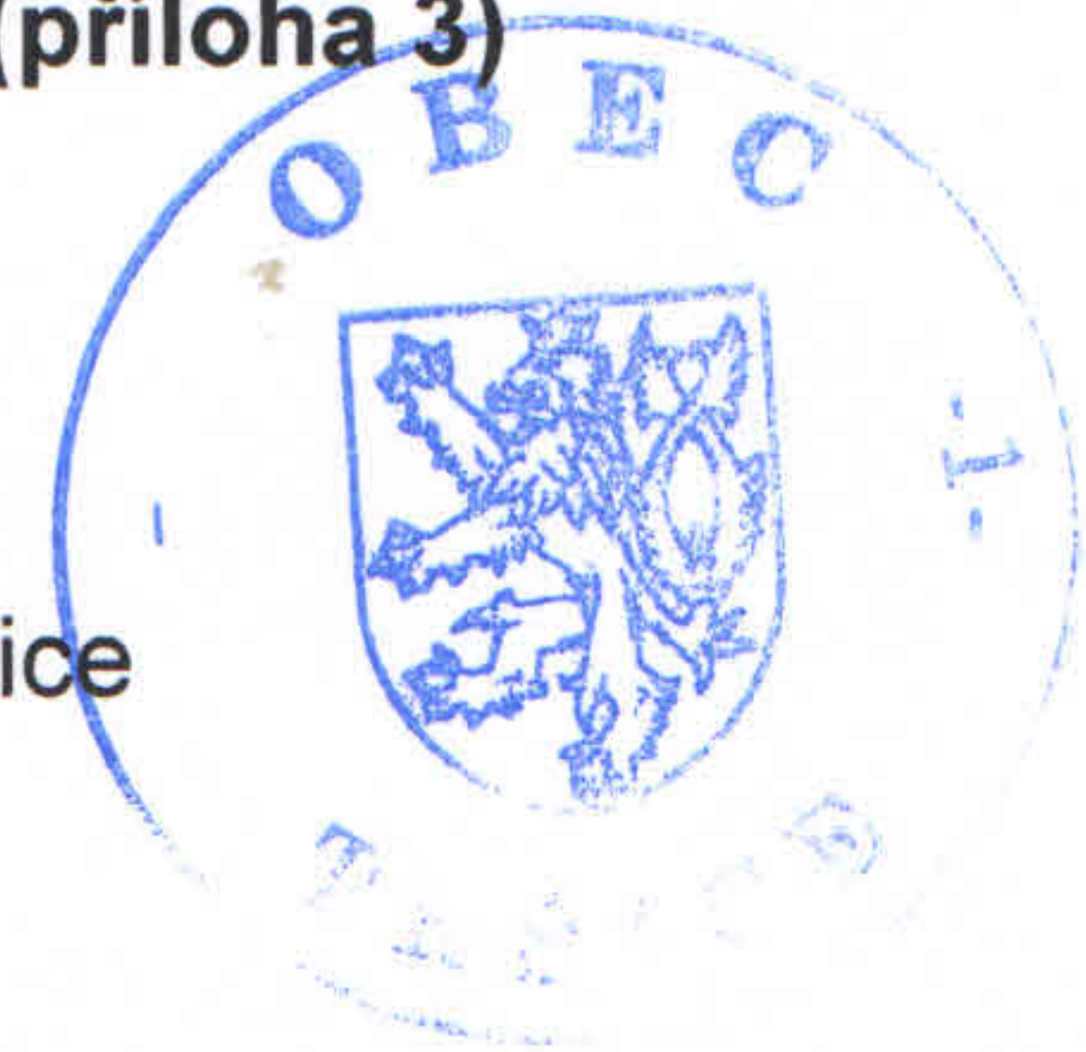
Jan Březovský místostarosta Obce Tršice

Ke zřízení věcného břemene - služebnosti se lze vyjádřit do 11.5.2015 na Obecním úřadě v Tršicích v úřední dny: pondělí a středu od 8 do 12 hodin a od 13 do 17 hodin.